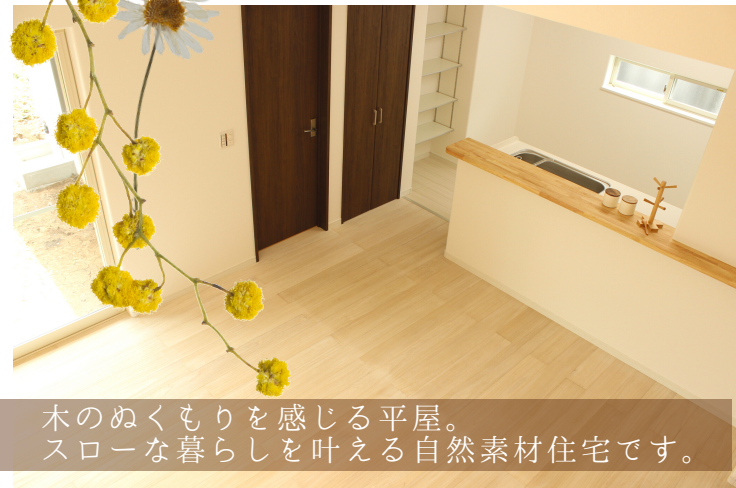
木のぬくもりを感じる平屋。 スローな暮らしを叶える自然素材住宅です。

[益城惣領モデルハウス概要] ■所在/上益城郡甲佐町大字芝原字芝原第二67番1 ■交通/「芝原」バス停 徒歩1分 ■設備/公営上下水道、合併浄化槽、プロパンガス、九州電力 ■接道状況/方角：南 幅員：6m 公道 接面：17.91m ■地目/宅地 ■用途地域/無指定 ■都市計画/市街化区域外 ■地勢/平坦 ■構造/木造平屋建てガルバリウム葺き ■取引形態/売主 ■建物設備/洗面化粧台、ユニットバス、システムキッチン(当社指定)、無垢床、照明器具、断熱材セルローズファイバー、防腐・防蟻工事ほか ■販売価格/2,580万円(税込み) /4LDK/土地面積231.21㎡(69.94坪)/建物面積92.74㎡(27.10坪)/令和4年7月建物完成/ ■駐車場/2台 ■甲佐町補助金あり ※別途費用がかかります。